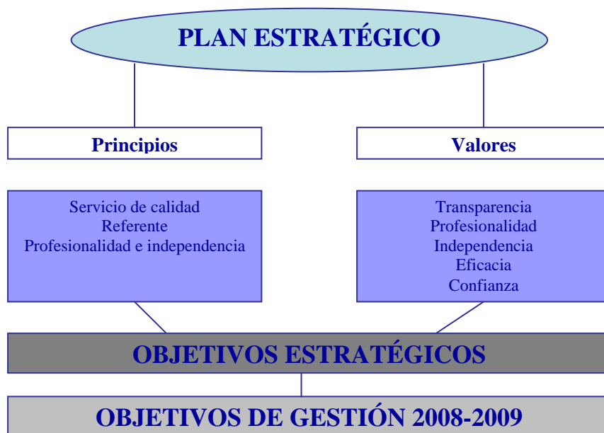
Planteamiento estratégico del TVDC.

Estos tres principios son los que guían su actuación. Se trata de los ejes que regirán las actuaciones y los planes de gestión anuales y servirán de apoyo para la monitorización global y sistemática de la actuación del Tribunal.